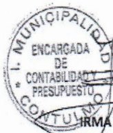
IRMA TOLEDO COLOMA ENCARGADA DE CONTABILIDAD Y PRESUPUESTO (S)